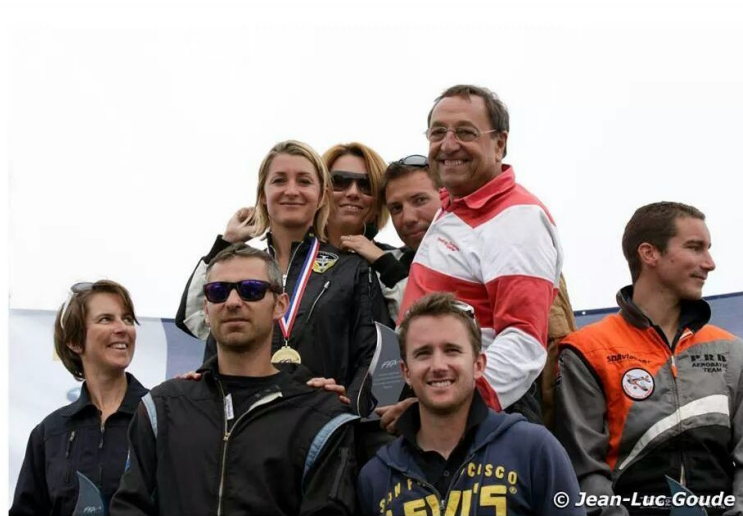
Championnats de France de Voltige Aérienne